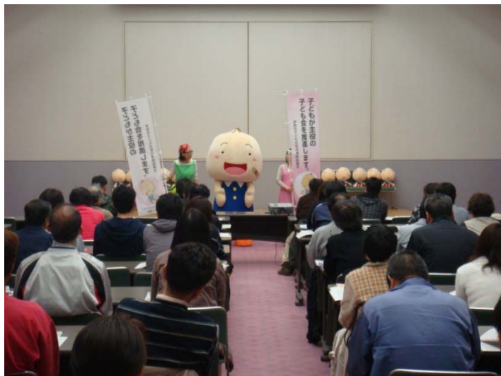
子ども会育成会役員さん達が集まる研修会にも登場！