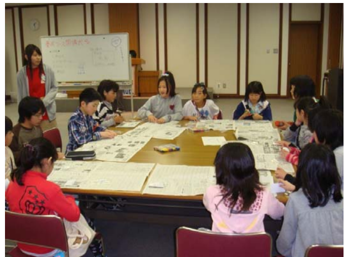
班ごとに自己紹介や名札作りをしています

5月13日に開講したジュニアリーダー養成コース。受付でCLCメンバーと会話する参加者は少し緊張した面持ちでしたが、帰る頃には自然に笑い合えるようになっていました。参加者の出身地区も様々で、対象の小学生はもちろん、中学生や高校生まで集う中、みんなで“楽しいこと”ができるって貴重な機会だと思います。色々な体験ができる場として、大いに楽しんでほしいと思います。