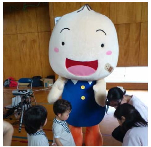
ちーぼも遊びに行きました！

また来年も新しいおもちゃを作ったり、かえっこバザールをするので、楽しみにしてください。