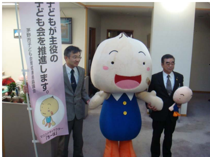
まずは市長にお披露目しました

今後、様々な市内の子ども会行事に出かけていきますので、「ちーぼ」を見かけたときは一緒に仲良く遊んでくださいね！