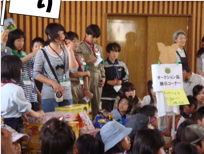
大盛況だったかえっこバザールオークション