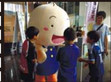
7/15 サイエンスフェスタのスペシャルゲストに！