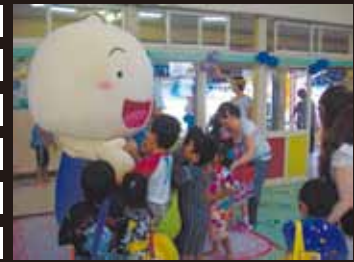
7/20 みどりヶ丘保育園夏祭りで大人気！