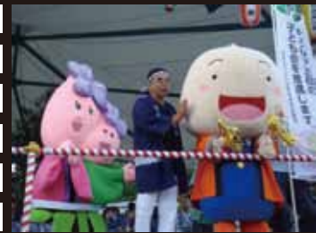
8/4 茅野どんぱんで大はしゃぎ！

4月に誕生したちーぼの着ぐるみですが、初めての夏に、あちこちのイベントに駆けつけました！ みなさんの地区の子ども会行事にも、ぜひ呼んでくださいね！