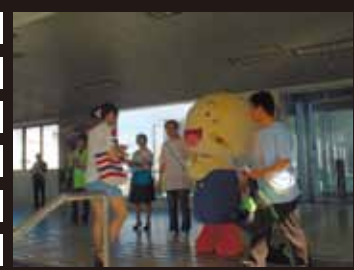
7/2 青少年健全育成街頭啓発で啓発物配り

8月4日はれ 茅野どんぱんに遊 びに行ったよ。みんな 元気で、おもわず市長 さんたちとおどっち やった。 そしたら、りんごの の花のようせい「のり んどんぱんどん」が出 てきたんだ。なかよし の友だちになったよ。