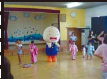
7/27 宮川第2保育園夏祭り、子ども達と歌ったよ