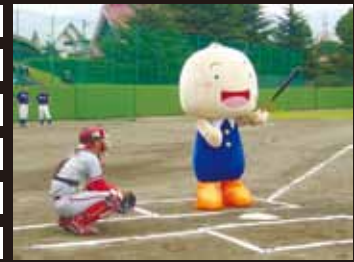
7/14 グランセローズ公式戦の始球式に登場！