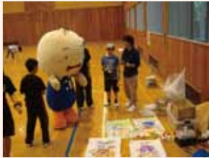
森 de ちーぼの作品はちーぼの Facebook で見れるよ！

出会ったばかりの子ども達がいづの間にか仲が良くなり、初めは緊張でこわばっていた顔も満面の笑みに変わり、それぞれのプログラムを楽しむ余裕がでて、夕食作りは手際よくおいしいカレーとサラダができました。目を見張るほどお代わりをした子もいて、親御さんに見て