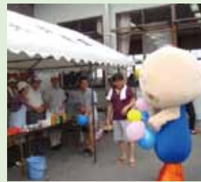
ちーぼも子ども達に風船を配ったんだ。ジュース飲みたいな…

7月28日、沢山の区民の皆さんが集まり、盛大に行われた中大塩子どもまつり。思い思いに飲んだり食べたりしてニコニコ顔の子どもたちを見ると、つくづく素晴らしい行事だなあと感じます。コミュニティセンターの中ではおなかいっぱいになった子ども達が、射的やストラックアウトなどゲームを思う