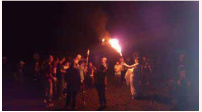
火の神登場、気分も最高！

キャンプファイヤーは圧巻でした。火の神の登場も、昼間練習したダンスも感動です。参加した