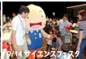
9/14 サイエンスフェスタ