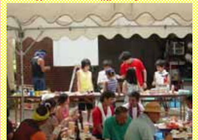
ピンゴ大会を子どもが進行