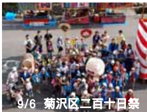
9/6 菊沢区二百十日祭