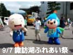
9/7 諏訪湖ふれあい祭