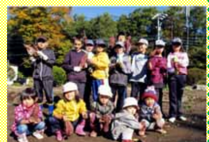
大きなサツマイモがとれました