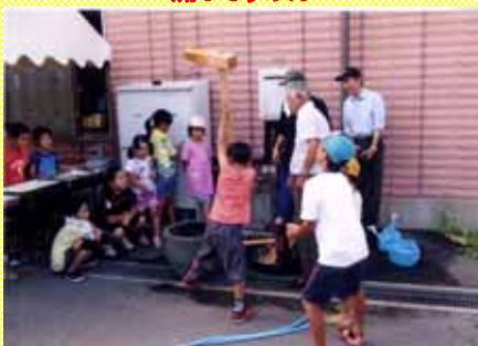
高齢者クラブと協力してもちつき