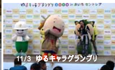
11/3 ゆるキャラグランプリ