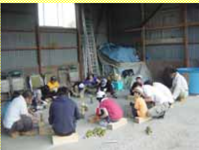
保育園児から大人まではし作り