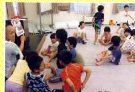
地域の歴史も勉強しました

モデル事業について詳しく知りたい方は、裏面の事務局までお気軽にお問い合わせください。