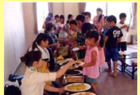
みんなでおいしくいただきました