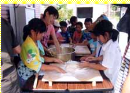
つきたてのおもち