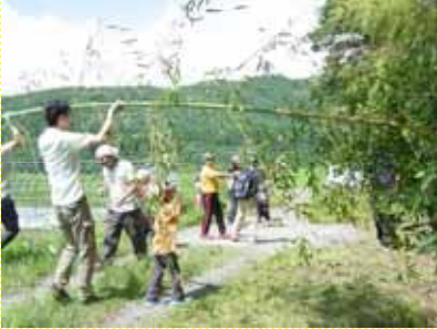
はしの材料となる竹の切り出し