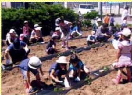
みんなで一緒に農作業