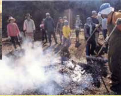
たき火でお楽しみの焼きいも