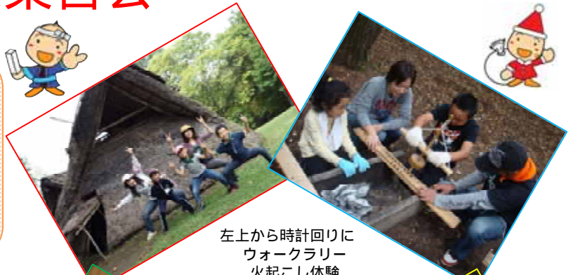
左上から時計回りに ウォークラリー 火起こし体験 夕食のピザ クリスマスリースづくり