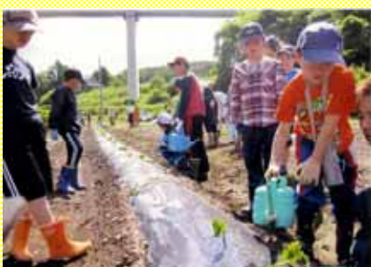
大人から教わりながら苗を植えた