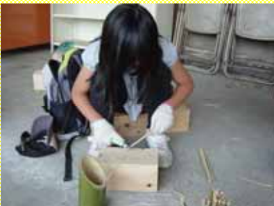
竹を削ってはしを作る