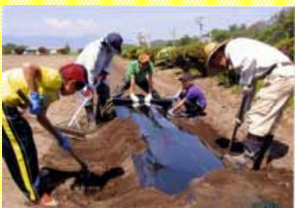
6年生役員が事前に苗床を作る