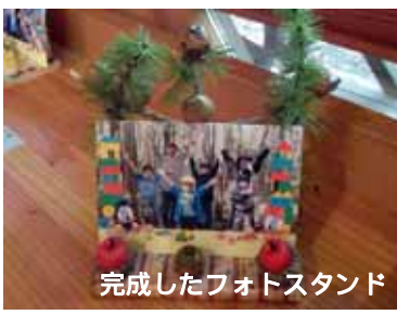
完成したフォトスタンド