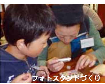
フォトスタンドづくり