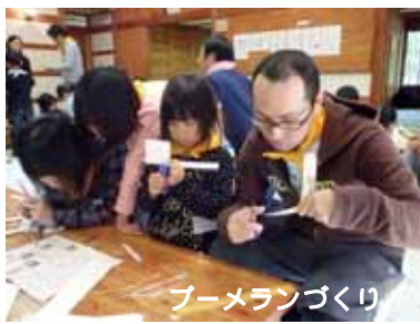
ブーメランづくり