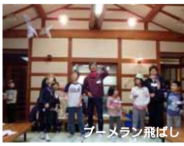
ブーメラン飛ばし