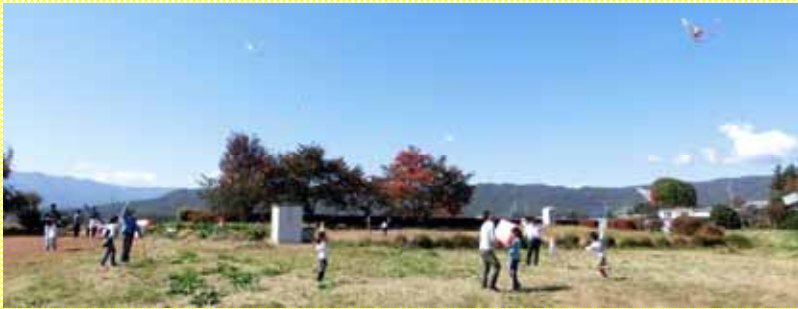
青空に高くあげられたいくつもの凧