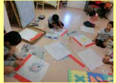
事前にスタッフで凧の試作