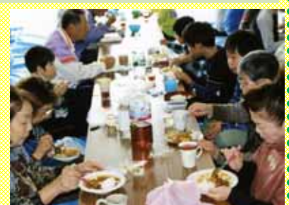
感謝の気持ちを込めたパーティー