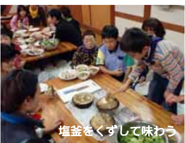
塩釜をくずして味わう