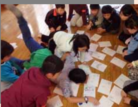
ものづくりではかるたを作ったり、ケーキ作りを試みたり