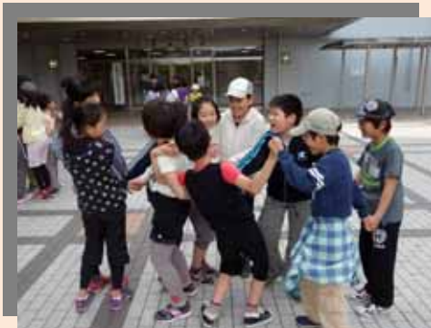
屋外でも屋内でも豊富なレクリエーションゲーム(右は出前講座)