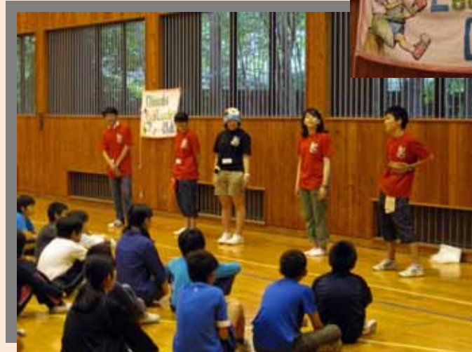
高校生スタッフがプログラムの進行役