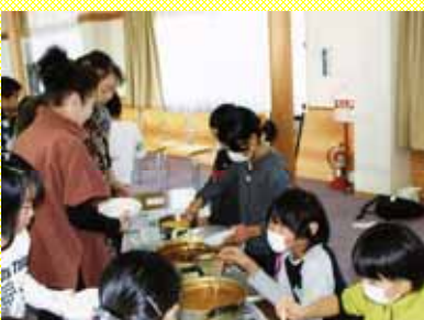
安全パトロールの方々を招待