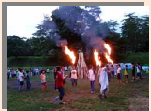
夏のキャンプでは自然の森でウォークラリーやキャンプファイヤー