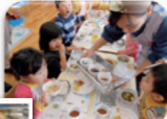
だしの香り体験しました

保育園では、さまざまな体験を通して食べ物を知り・覚え・食べる活動を行い、食べることを楽しみにできる子どもになってほしいと願っています。