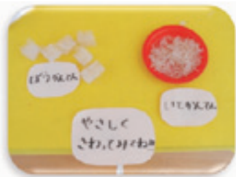
食材に触る体験コーナーを作りました