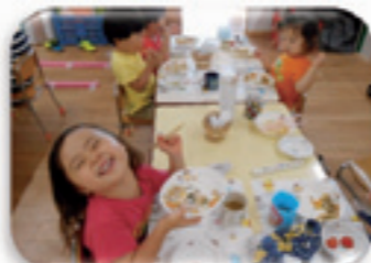
栄養マンが来るのを楽しみにしています