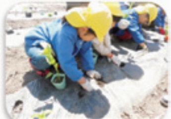
野菜の成長を植え付けから体験します