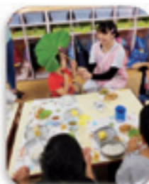
毎月旬の食材を紹介しています